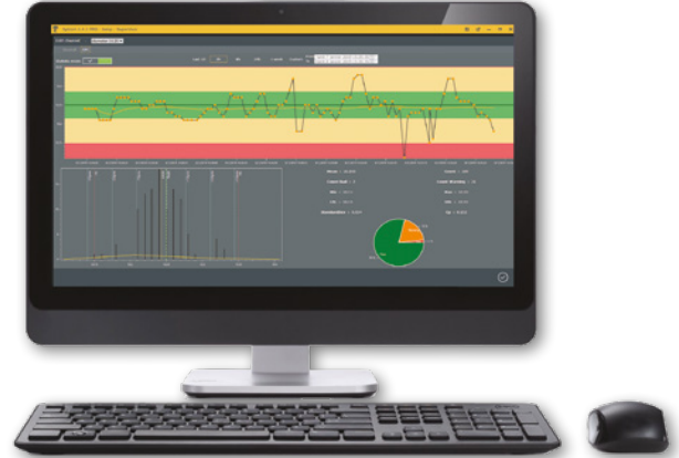
Sylcom LITE versión gratuita en www.sylvac.ch

La última adición a la gama de software de Sylvac, tiene como propósito procesar la información procedente de aquellos instrumentos conectados inalámbricamente mediante Bluetooth® o bien por cable USB. Este software permite crear un número casi ilimitado de canales de visualización repartidos en una o varias páginas. Hay disponibles distintos modos de visualización que permiten supervisar instantáneamente el estado de la variable medida (PASA/NO PASA). Sylcom permite además medir piezas de manera secuencial, así como recabar simultáneamente el conjunto de valores, o bien definir un intervalo específico para registrar automáticamente los valores medidos. Los datos podrán guardarse en Sylcom y exportarlos más tarde a un archivo de Excel.