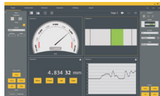
Visualización de múltiples canales con indicación de tolerancias mediante colores