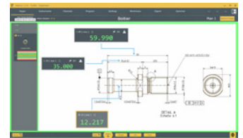
Rangos de control